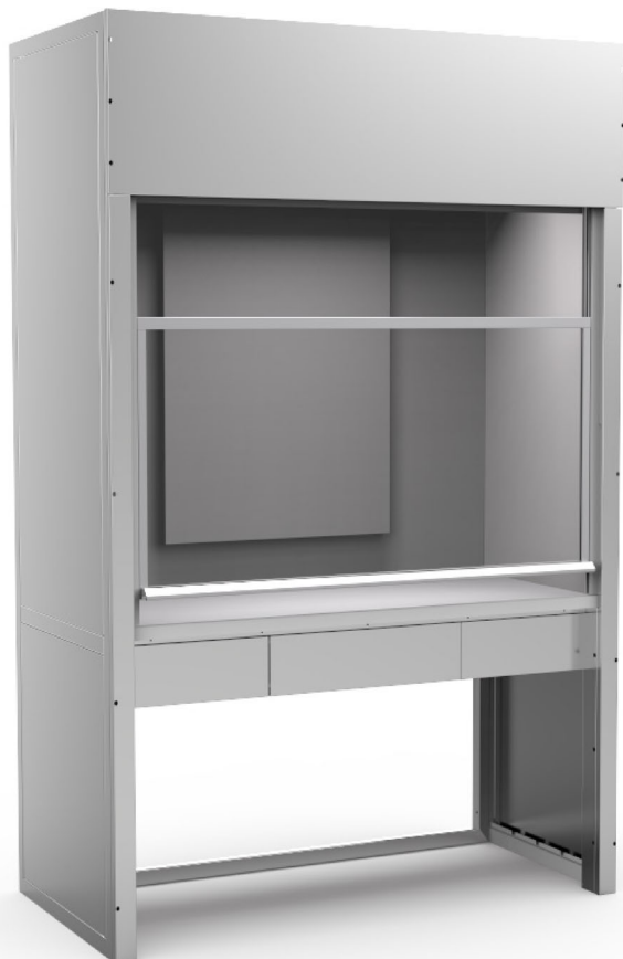
Alsó tároló szekrény

Előfordulnak nem szokványos alkalmazási területek, melyek különleges igényeket támasztanak a vegyifülkékkel szemben. Ilyen speciális terület a robbanásbiztos környezet. A CerLaton ATEX vegyifülkéink teljesítik az ATEX zónabesorolás által támasztott szigorú követelményeket mind a villamos, mind a nem villamos részek vonatkozásában. Az elektromos szerelvények nem a fülkében, hanem attól 1,5 méterre, egy külső kapcsolószekrényben kerülnek elhelyezésre. A villamos berendezések védelmi jele: IIzGExdeialICT4Gb. A fényforrás külső elhelyezésű, robbanásbiztos kivitelű, fénycsöves armatúra. Védelmi jele: Ex II 3GD Ex nA II T4 T78 °C. A zónában telepített vegyifülkéinket ATEX szabványú ventilátorokkal szállítjuk. A ventilátor és a fülke közt horganyzott légtechnikai csőszakasz teremt kapcsolatot. A fülke nem villamos berendezéseinek védelmi jele: IIzGExdeialICT4.