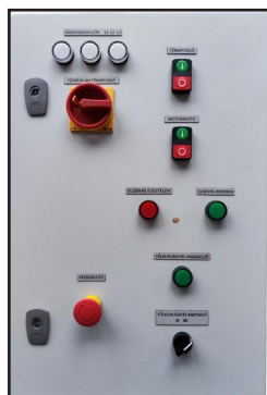
A fülke elérhető rozsdamentes acél belső felülettel (1.4301) – Cerlaton ATEX IN.